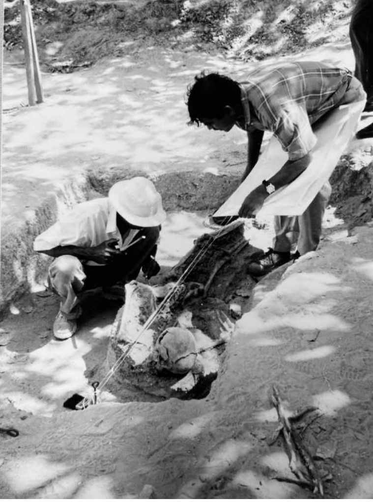
1999இல் செம்மணியில் நடந்த அகழ்வுப் பணியின்போது பேராசிரியர் நிரியல் சந்திரசிறி உள்ளிட்ட தடயவியல் நிபுணர்கள்.